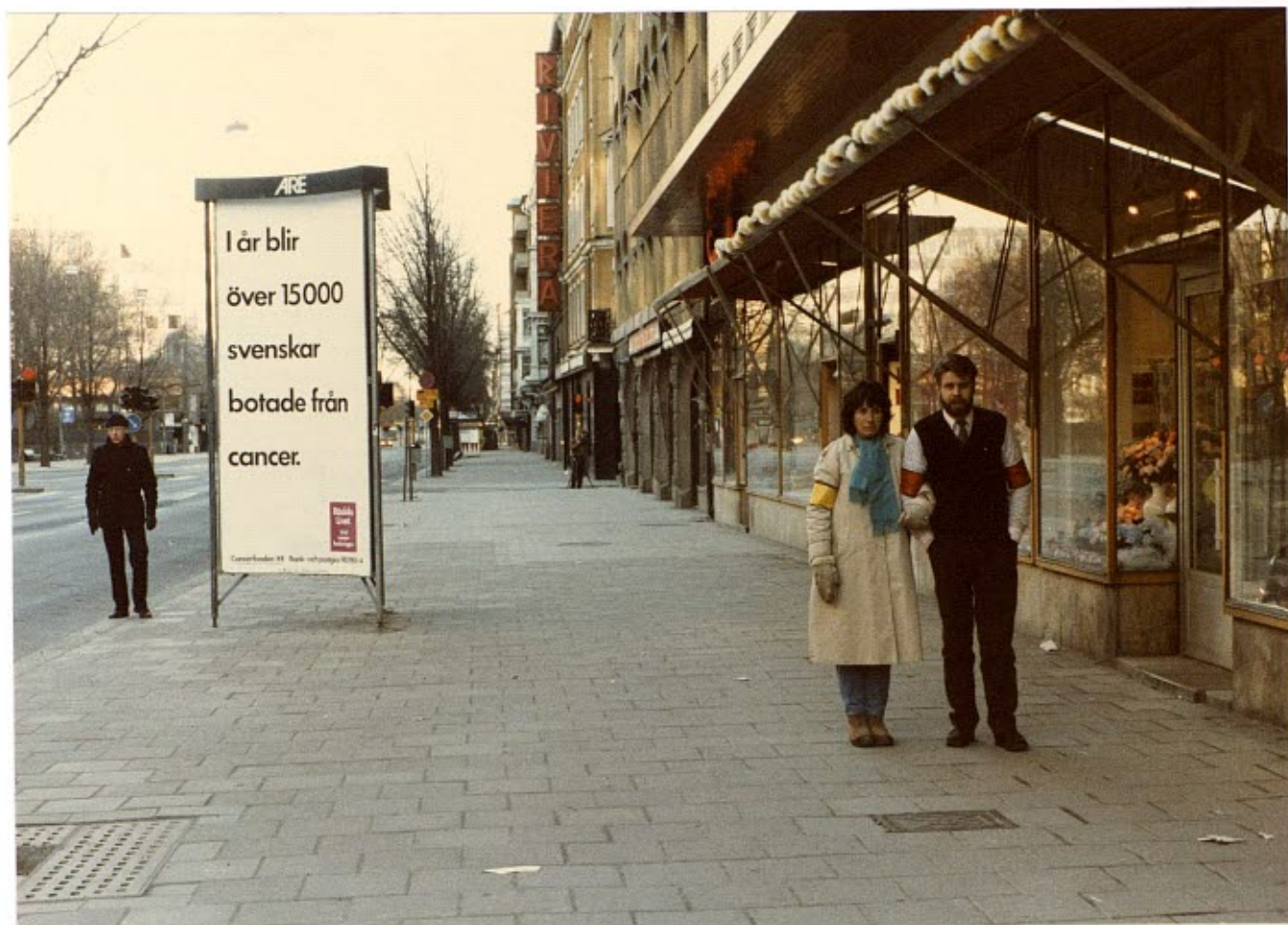
Nicola Fauzzi såg en man, som kom gående ca 10 meter efter makarna Palme.