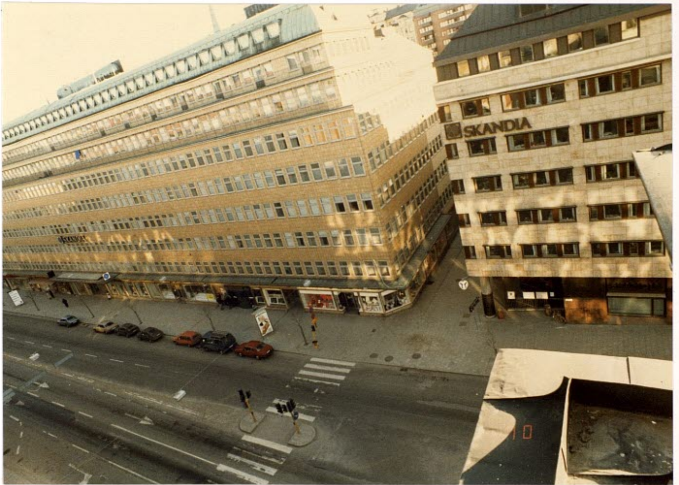
Nicola Fauzzi promenerade Sveavägen norrut på den östra trottoaren.